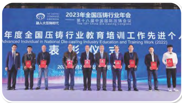
教育培训先进个人表彰合影

力劲集团 伊之密股份有限公司 阿瑞斯工业炉 布勒（中国）机械制造有限公司 意特佩雷斯压铸设备（上海）有限公司 宁波保税区海天智胜金属成型设备有限公司 伟杰科技（苏州）有限公司 数益工联 航天工程装备（苏州）有限公司 广东创世纪智能装备集团股份有限公司 平安国际融资租赁有限公司 苏州埃肯化学有限公司