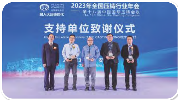
支持单位致谢仪式