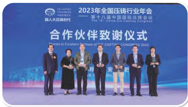
合作伙伴致谢仪式